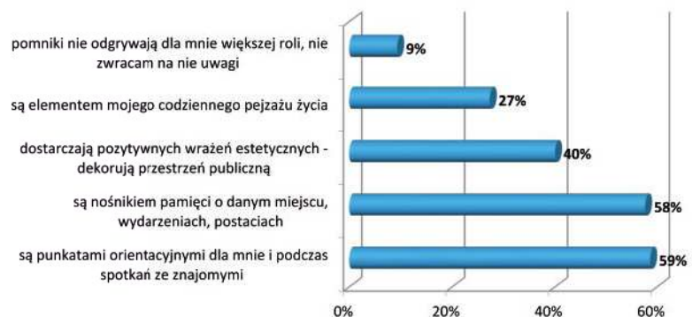
Funkcje pełnione przez pomniki w przestrzeniach publicznych Poznania [% wskazań respondentów]

Suma udzielonych przez respondentów odpowiedzi przekracza 100%, ponieważ ankietowani mogli wskazać trzy odpowiedzi.